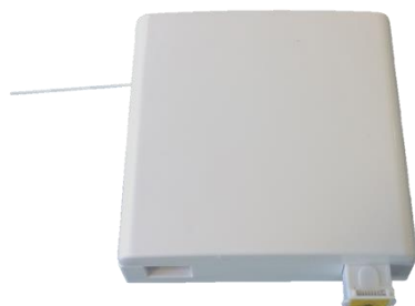
Gniazdo abonenckie serii GAP zamknięte

Gniazda abonenckie serii GAP przeznaczone są jako zakończenia linii abonenckich.