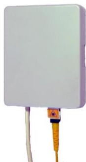
Gniazdo abonenckie serii CTB2-A

Gniazda abonenckie serii CTB2-A przeznaczone są jako zakończenia linii abonenckich.