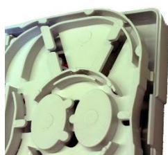
Gniazdo abonenckie serii CTB2-A /wyróżniony zatrzask blokujący/