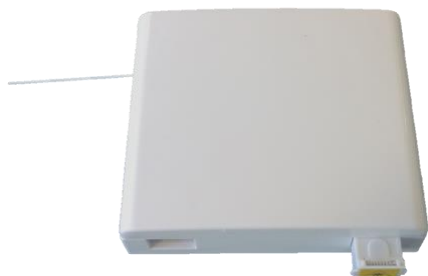
Gniazdo abonenckie serii GAP zamknięte

Gniazda abonenckie serii GAP przeznaczone są jako zakończenia linii abonenckich.