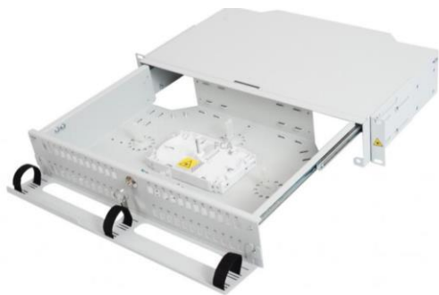
Pusta przełącznica panelowa PSP-T-2U-48, zawierająca kasety.

Przełącznica panelowa PSP-T do zastosowań w węzłach optycznych.