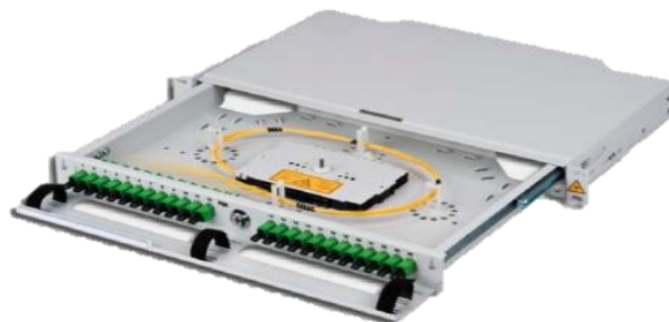
Przełącznica panelowa PSP-T-1U-24 w komplecie zamawianym dodatkowo