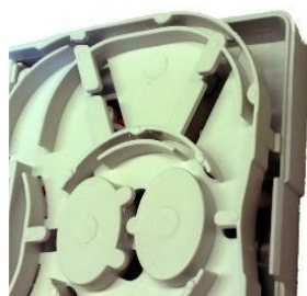
Gniazdo abonenckie serii CTB2-A /wyróżniony zatrzask blokujący/