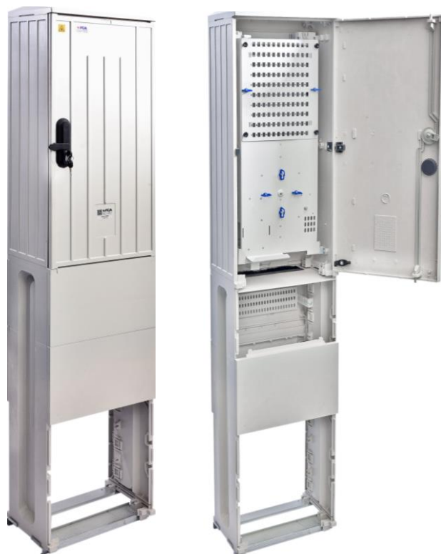
Słupek światłowodowy serii SUS-PH

Światłowodowa szafka kablowa przeznaczone do zastosowań FTTH