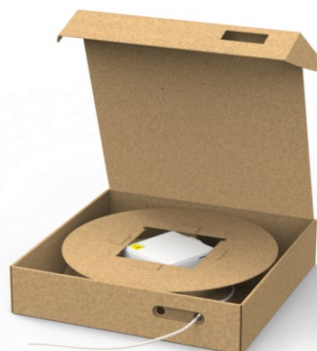
Zestaw instalacyjny BOX z kablem abonenckim