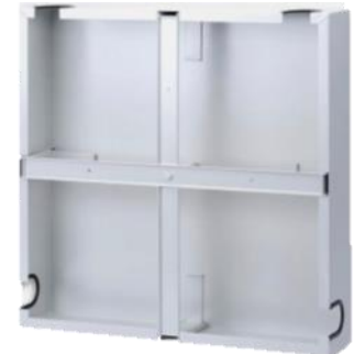
Stelaż zapasu kabla z pokrywą STZK-60-N – widok z tyłu