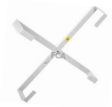
Stelaż ścienny serii STZK

Stelaże zapasu kabla umożliwiają bezpieczną organizację zapasu kabli z zachowaniem ich rekomendowanego promienia gięcia.