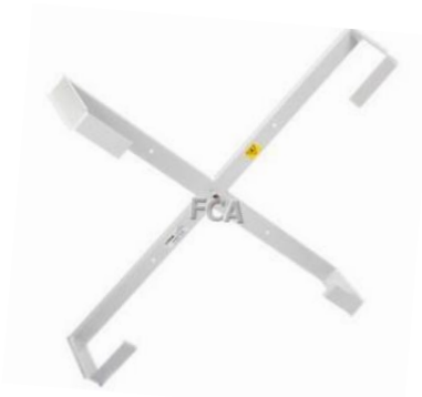
Stelaż ścienny serii STZK

Stelaże zapasu kabla umożliwiają bezpieczną organizację zapasu kabli z zachowaniem ich rekomendowanego promienia gięcia.