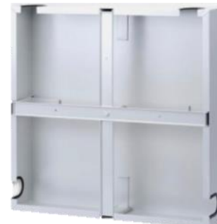
Stelaż zapasu kabla z pokrywą STZK-60-N – widok z tyłu