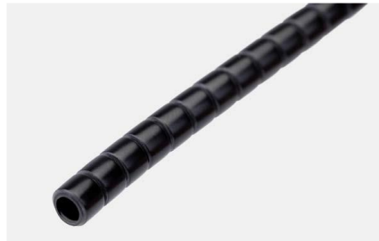
Tuba transportowa TR-5 czarna

Spiralna tuba transportowa do prowadzenia tub kabla światłowodowego w szafach centralowych i skrzynkach dystrybucyjnych