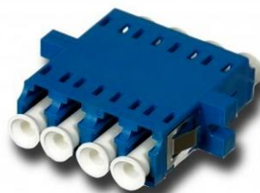
Adapter LC/PC Quad Lite