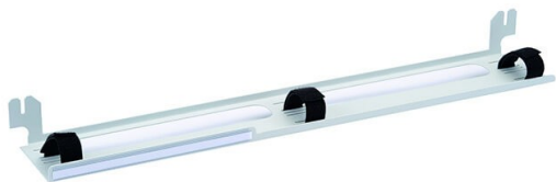
prowadnica patchcordów OPTI PP